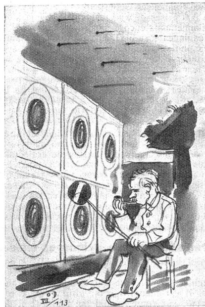
Arbeitslos — alles Härdöpfel.