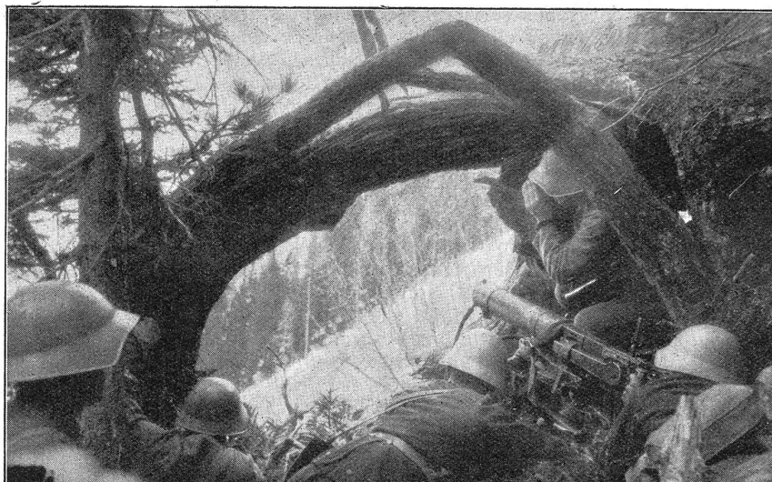
Von der I.-R.-S. IV/3 in Thun 1931. Maschinengewehrstellung im Gebirge.