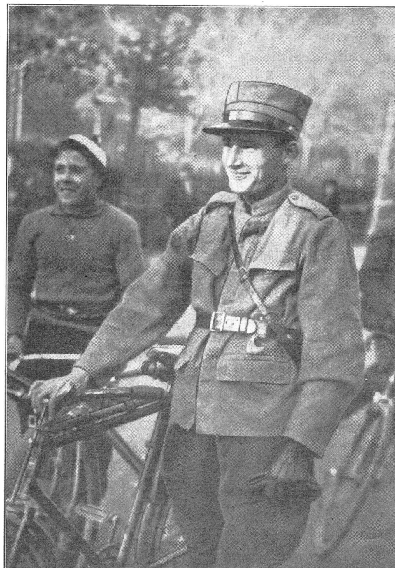
Schweiz. Militärradfahrer-Meisterschaften in Basel.

Als Abschluß der Tagung fand im großen Saale der « Olympia » in Airolo eine kleine Feier statt. Manch einer mag sich beim Anblick des von den Offizieren und Unteroffizieren überaus reich dotierten Gabentisches vorgenommen haben, sich nächstes Jahr noch mehr anzustrengen! Nach kurzer Begrüßung wurde die Spannung der Kanoniere endlich gelöst, indem die Rangverkündung und damit verbundene Preisverteilung vorgenommen wurde. Neidlos wurden die ersten beklatscht. Dann lauschte die Abteilung aufmerksam und kritisch den Worten des Feldweibels Flaig: Wert der Armee, Betätigung