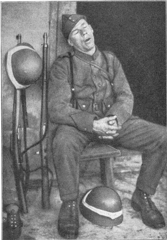
Manöver der 5. Division. — Manœuvres de la 5 e division.

Lieb' Vaterland, magst ruhig sein! — Oui, je veille sur toi patrie!