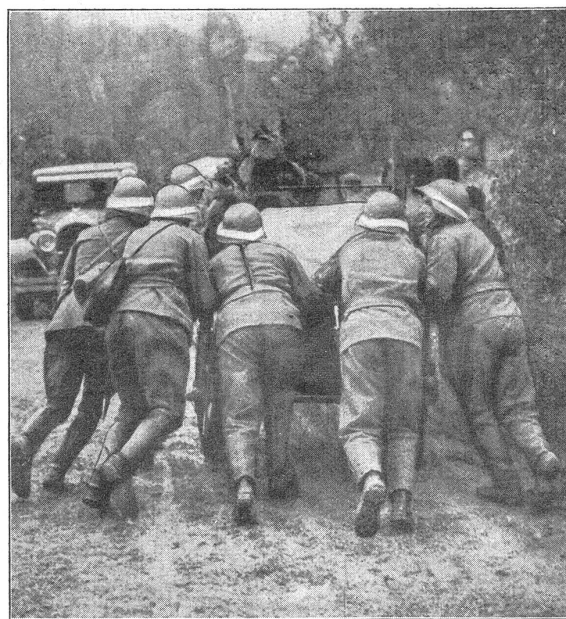
Manöver der 5. Division. — Manœuvres de la 5 e division. Vorwärts mit der «Gulaschkanone», die Flieger kommen. — En avant avec le « canon à spatz », les avions approchent !