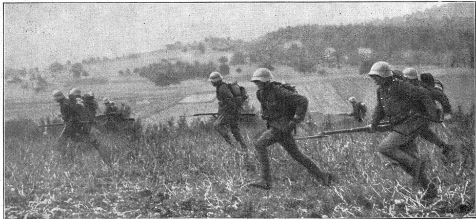
Manceuvres de la 5 e division. A l'assaut.