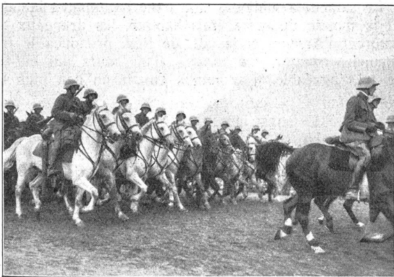
Defilee der 4. Division. — Le défilé de la 4 e division. Unsere prächtige Kavallerie. — Notre superbe cavalerie.

Die Defilees der I.-Br. 16 und der 4. Division haben gezeigt, wie sehr unser Volk mit seiner Armee verwachsen ist. Ueberall sind die Fahnen der Bataillone freudig begrüßt worden. In der Berner «Tagwacht» aber wagte es so ein Held, unsere Fahne in den Dreck zu zerren , indem er sie als «Mal der Unterdrückung und der Knechtschaft» und als «Sinnbild des Kapitalismus» bezeichnete. Erst hat es die Tagwacht unternommen, die Uniform als Schandlumpen zu titulieren und nun diese Besudelung des eidgenössischen Feldzeichens, das in unzähligen Schlachten unseren Vorfahren den Mut und die Zuversicht gegeben hat, uns ein gefestigtes und geeinigtes Vaterland zu schaffen. Dafür aber trägt dieses Presseerzeugnis der Bundeshauptstadt unentwegt stolz seinen vom verhaßten Militär gepumpten Namen Tagwacht. Phui! M.