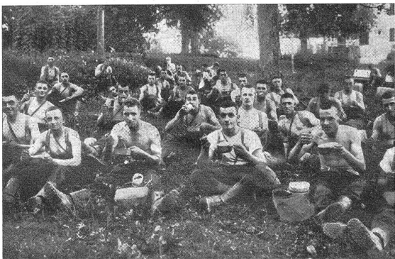
Unsere Radfahrer. — Nos cyclistes. Wohlverdientes Mittagessen im Freien. — Un diner en plein air bien mérité

Die Besorgnis, von Fliegern entdeckt zu werden, ist noch viel zu vorherrschend. Die ängstliche Rücksicht auf feindliche Flieger lähmt den Führerwillen und hemmt den