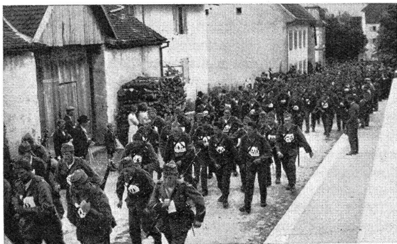
Der Abmarsch Au départ