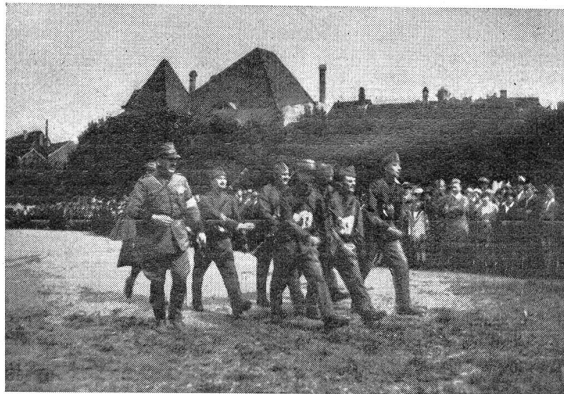
Ankunft der Patrouille Nr. 3