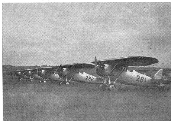
Schweiz. Dewoitine-Staffel Escadrille suisse Dewoitine

kletterten an das wolkenbeschwerte Himmelszelt, um sich um die Siegestrophäe der nationalen Akrobatik-Konkurrenz in verschiedenartigen Figuren und kühnen Evolutionen zu überbieten. Flugdemonstrationen des Engländers Buhmann und Vorführungen der französi-