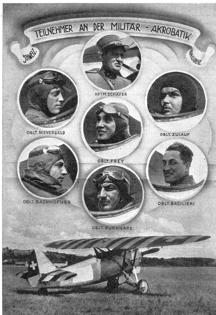
Participants suisses au concours militaire d'acrobatie