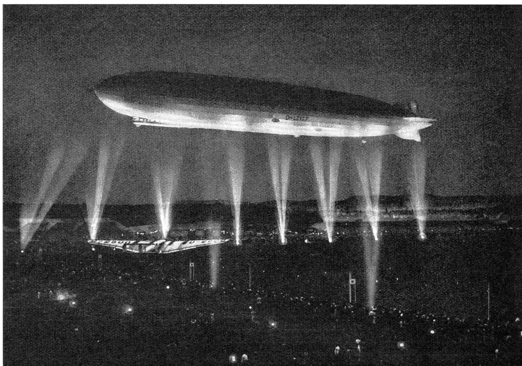
Nächtliches Manöver des Zeppelins

Une manœuvre de nuit du Zeppelin