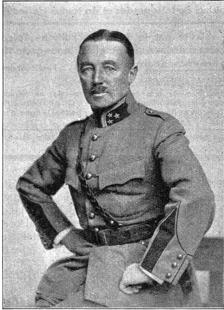
Oberstkorpskommandant Henri Guisan Kommandant des 2. Armeekorps