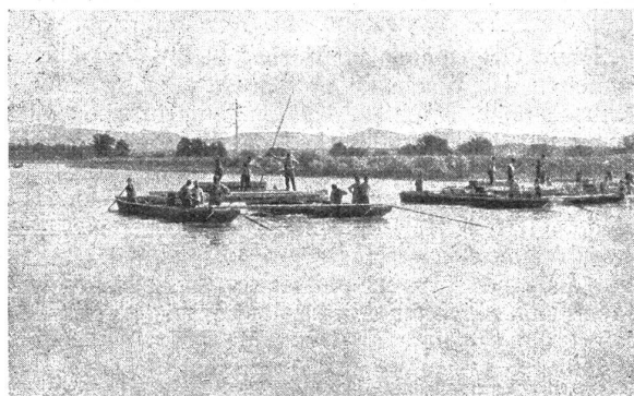
Zerlegen einer Pontonbrücke in einzelne Glieder.

Hierbei ist es nicht möglich, die Camions vor dem Uebergang über eine Kriegsbrücke vollständig zu entlasten, wie dies bei dem heutigen Stande unserer Ausrüstung erforderlich ist. Es ist daher auch bei uns die Schaffung eines schweren Ordonnanzmaterials im Gange für Kriegsbrücken, die ein Befahren durch schwere Motorlastwagen bis ca. 12 Tonnen Gesamtgewicht ohne