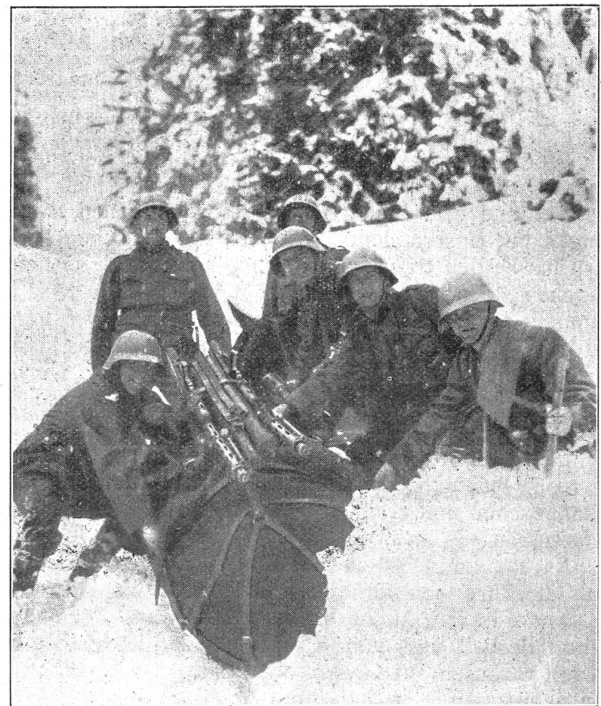
Mit vereinter Kraft: Das Tragtier wird «flott» gemacht. Et avec les bras de tous: ce cheval-porteur sera bientôt relevé. (Dubois)

«Wenn einer ein rechter Artillerist will sein, So muss er auch schwingen ein Tänzlein fein.»