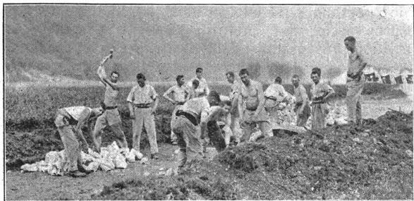
Mit vereinter Kraft: Flieger-Rekruten beim Strassenbau. Et avec les bras de tous: recrues des troupes d'aviation construisant une route.