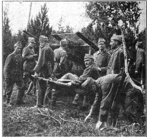
Improvisationsarbeiten. W. K. 1928. Davos. G. I. Bat. 93. Travaux improvisés. C. R. 1928 à Davos. Bat. Inf. mont. 93.

Kampf gegen den Militarismus und die Rüstungen, Kampf gegen den Kapitalismus! Auch der Kampf in Werkstätte und Fabrik für gewerkschaftliche Forderungen, der politische Kampf in Gemeinden und Staat ist ein Kampf gegen den Militarismus