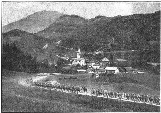
Auf dem Marsch bei Tiefenkaasel W. K. 1930. — G. I. Bat. 93 En route pour Tiefenkaasel. C. R. 1930. — Bat. Inf. mont. 93.

Gebirgsgeländes. Sie bringt aber in den Wiederholungskurs den Nachteil mit sich, dass bei in mehreren Dörfern zerstreuten Kantonnementen — was im Gebirge häufig der Fall ist — es nicht mehr möglich ist, die Bataillonssanität jeden Tag zu Übungszwecken zusammenzuziehen. Dies wäre umso notwendiger, als