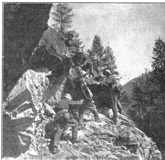
Auf der Suche nach den Verletzten. W. K. 30 Tinzen, Geb. I. Bat. 93. I. und II. Komp. A la recherche des blessés. C. R. 1930 à Tinzen, Bat. Inf. mont. 93. Cp. I et II.

In der Luzerner Arbeiterzeitung jammerte im Anschluss an den W. K. des Geb. I. Bat. 87 wieder einmal so ein «Held» in allen Tonarten über den wahnsinnig strengen Dienst. Die Redaktionen unserer roten Blätter legen ja unendlichen Wert darauf, durch Jeremiaden von Soldaten über wahrwitzige