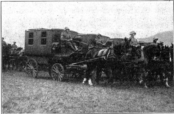
Défilé der 3. Division. — Défilé de la 3me Division.

J'ai parcouru moi-même le bivouac dans toute son étendue pour y exercer la fonction qui m'incombe au service. Je n'ai rien entendu qui me permette de croire que la troupe s'en est plainte comme voudrait l'insinuer le fameux correspondant.