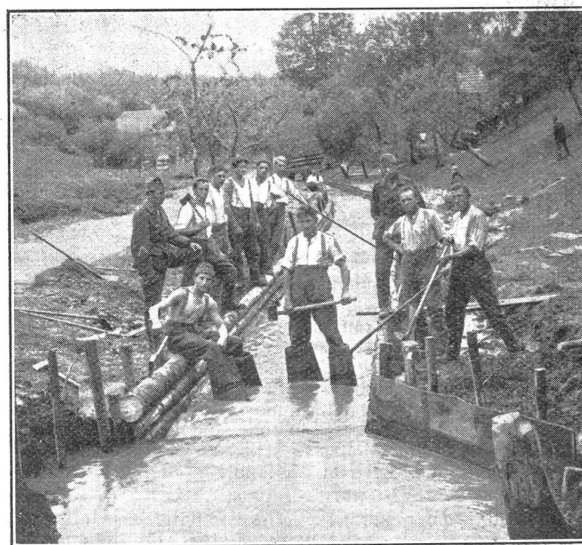
W. K. 1931 des Sap.-Bat. 3 im Unwettergebiet des Emmentals. Der Wildbach in Fesseln.