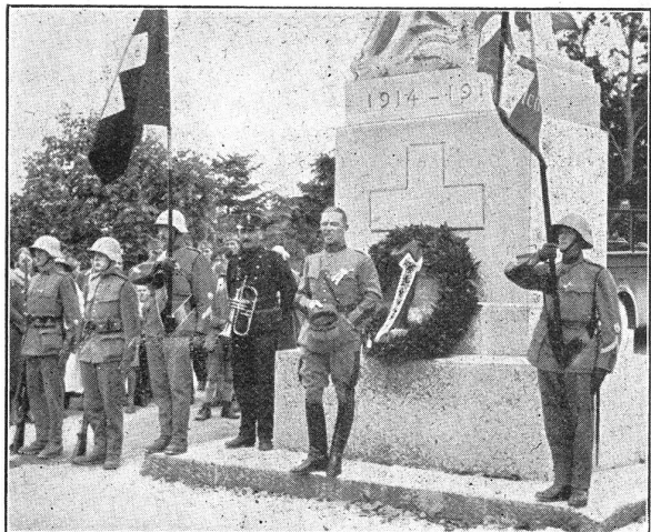
Militärfechtturnier auf La Caquerelle. Ansprache von Herrn Oberstdivisionär Guisan vor dem Soldatendenkmal.

Tournoi militaire d'escrime à La Caquerelle. Discours de Mr. le Col. div. Guisan devant le monument des soldats.