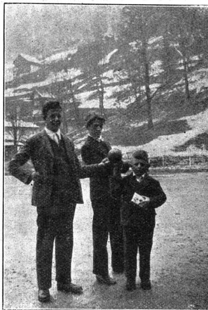
Rekrutenprüfung. — Der kleinste und der grösste Rekrut von Uri. Der 124 cm hohe — übrigens sehr intelligente — junge «Mann» zog die vom Aushebungsoffizier offerierte Schokolade einer Schachtel Zigaretten vor!

L'examen de gymnastiques des recrues. L'auscultation après la course de vitesse!