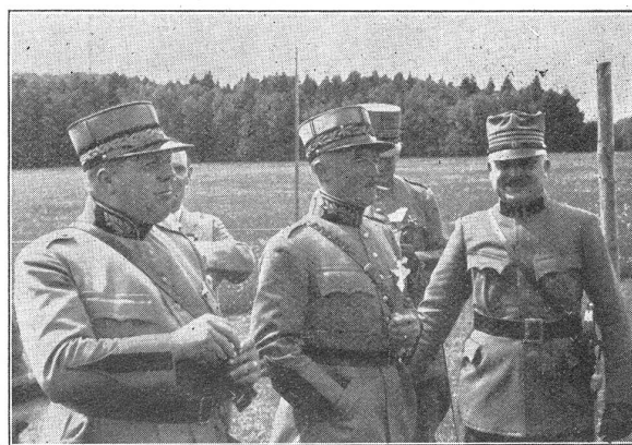
Militärfechtturnier auf La Caquerelle. Hohe Gäste: von links nach rechts: Oberstdiv. de Diesbach, Kdt. 2. Division; Oberstdiv. Guisan, Kdt. 1. Division; Oberst Cerf, Verfasser des Buches «Der Krieg an der Juragrenze».

Zur Mittagszeit wurde das Turnier unterbrochen