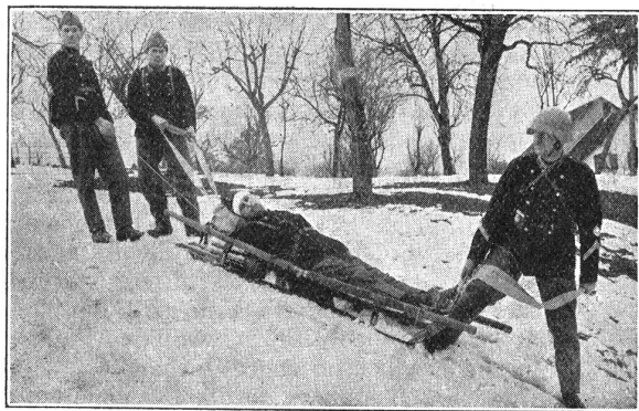
Improvisierte Skibahre. Brancard-ski improvisé.

wendet werden, die Gespanne der Blessiertenwagen abgelöst und die Pferde untergebracht und gefüttert werden. Je nach dem Gelände wird es notwendig sein, die Blessiertenwagen vierspännig zu fahren; deshalb werden die Fuhrwerke, die direkt zur Kompanie gehören, d. h. die 3 Gebirgsfourgons, die 3 Blessiertenwagen sowie die Küche vom Sattel aus gefahren.