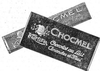
Ein nahrhafter Leckerbissen