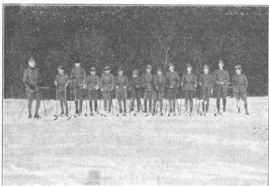
Basler Kadetten auf einer Skitour. Cadets bâlois en ski.

Voilà qui va faire pâlir d'envie nos critiques militaires ! — Qui aurait cru que Berne puisse recevoir ces conseils de nos rédactions bolchévistes pourtant si pacifistes ? . . . Dans le « Droit du Peuple » de Lausanne, ce sont d'autres considérations techniques sur notre aviation et toujours leur auteur conseille ceci ou cela à notre département militaire fédéral ! Pour des amateurs de désarmement, ce n'est pas mal ! On n'y parle que de bombardement, d'avions de chasse et d'autres engins meurtrier et on déplace le choix de nos experts qui ont