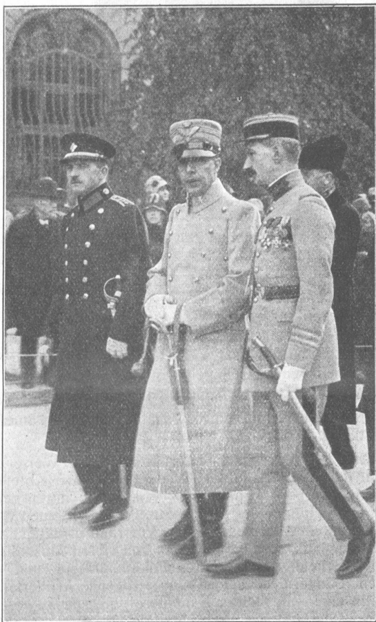
Fremde Offiziere im Trauerzuge. C. Jost Officiers étrangers prenant part au cortège funèbre.

Gleichsam als Uebergang zum gemütlichen Teil dislozierte zirka ¼3 Uhr die ganze Tagung in das heimelige Restaurant im historischen «Hof» droben, wo inzwischen noch weitere Nachzügler eingetroffen waren, so dass die Präsenzlisten zirka 130 Mann rapportierten, die das grosse Restaurant bis auf den letzten Platz besetzten.