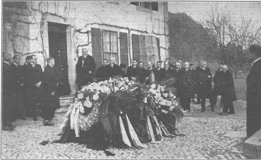
Der aufgebahrte Sarg vor Bundesrat Scheurers Wohnhaus in Gampelen. Le cercueil devant la maison du conseiller fédéral Scheurer.