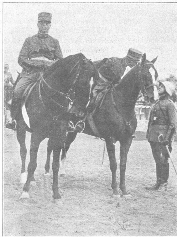
Die letzte Photo Bundesrat Scheurers, die für den «Schweizer Soldat» bestimmt war.

Um 12 Uhr begaben sich sodann die Teilnehmer in den mit den eidgenössischen Farben sinnvoll geschmückten Saal des Hotels Schwanen, allwo ein vorzügliches Mittagessen serviert wurde. Eine angenehme Ueberraschung war den Erschienenen zuteil, als jeder