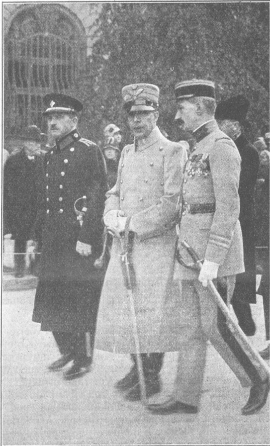
Fremde Offiziere im Trauerzuge. C. Jost Officiers étrangers prenant part au cortège funèbre.

Gleichsam als Uebergang zum gemütlichen Teil dislozierte zirka ¼3 Uhr die ganze Tagung in das heimelige Restaurant im historischen «Hof» droben, wo inzwischen noch weitere Nachzügler eingetroffen waren, so dass die Präsenzlisten zirka 130 Mann rapportierten, die das grosse Restaurant bis auf den letzten Platz besetzten.