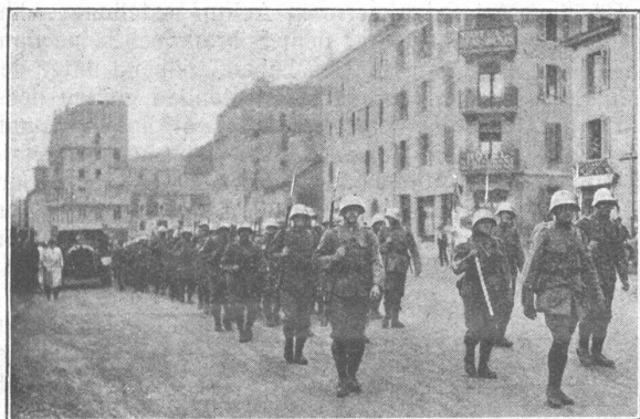
Auszug des Genfer Regiments. — Départ du régiment Genevois. M. Wassermann, Genève.

Ein wunderliches Gefühl hatte sich Meiers bemächtigt, seine Füsse schienen mit Flügeln behaftet, so leicht kamen sie ihm vor. Ja, er glaubte, kaum den Boden zu berühren, als taumelte er betrunken, und doch konnte er sich mit eigenen Augen überzeugen, dass er