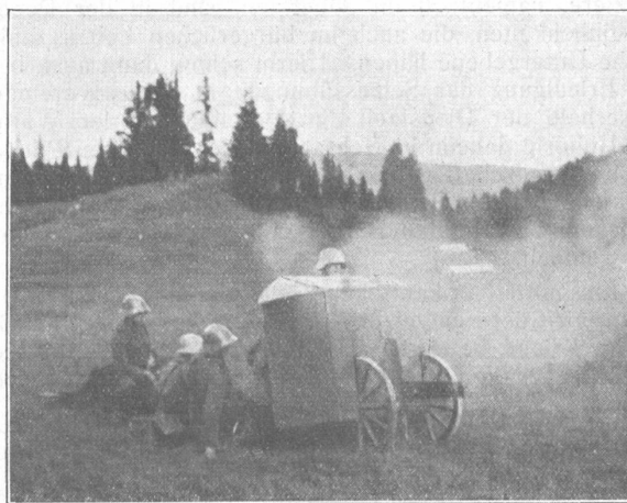
Gebirgs-Artillerie im Feuer. Artillerie de montagne. Ouvrez le feu!

«Verteidigung» ist der klare Gedanke, aus dem das Schweizer Milizsystem seine Kraft zieht. Und diese Uebungen inmitten einer Gipfelwelt sind der denkbar beste Anschauungsunterricht für den städtischen Angestellten, Fabrikarbeiter usw., welche Werte er zu verteidigen hat, und wie sehr die Natur seines Landes ihm die Abwehr erleichtert. Die angreifende Partei in dem erwähnten Jura-Manöver war nicht zu beneiden. Auf engen, gewundenen Strassen, die bereits jedes liegen-