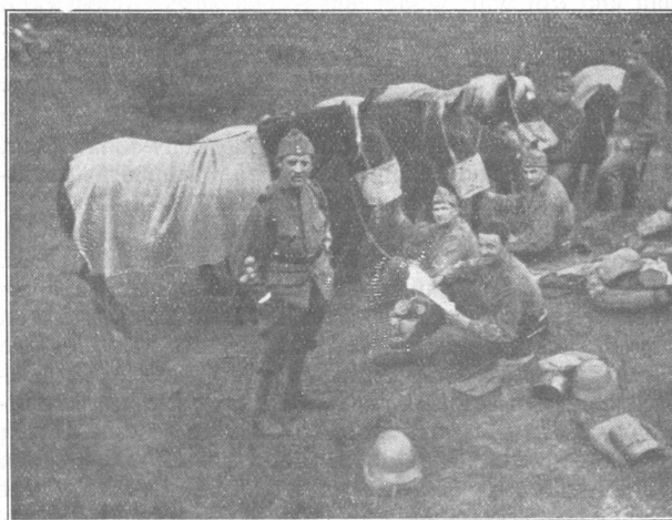
Abonnentenwerbung im Felde. Acquisition d'abonnés en campagne.

Am 28. September, morgens 7 Uhr, geht's mit dem Gerassel der angespannten Geschütze über das holperige Pflaster der Strassen von Schwyz. Langsam windet sich die Kolonne von 130 Pferden und 250 Mann der Batterien 4 und 8 durch die Gassen der sich langsam belebenden Stadt mit Richtung Rickenbach-Ibergereg. Trüb und grau ist der Himmel. Weder Rigi, noch Mythen sind sichtbar. Auf der Fahrstrasse geht's langsam bergauf, gegen Osten wird's heller, durch gelblichen Dunst wird die gelbe Scheibe der Sonne sichtbar, strahlenlos hängt sie oben am fast farblosen Himmel. Gegen Norden zeichnen sich in verschwommenen Umrissen die Mythen im blauen Dunst und plötzlich brechen die Strahlen der Sonne durch den Nebel und rings um uns ist eine herrliche Bergwelt in Gold gebadet. Zwischen Rigi und Seelisberg, Urirotstock, Fronalpstock und den Bergen am Vierwaldstättersee liegt ein leicht auf und ab wogendes Nebelmeer. In ruhigem, gleichmässigem Tramp geht's bergauf, gemütlich rauchen die Appenzel-