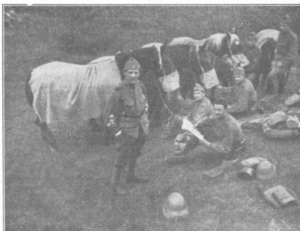
Abonnementwerbung im Felde. Acquisition d'abonnés en campagne.

Am 28. September, morgens 7 Uhr, geht's mit dem Gerassel der angespannten Geschütze über das holperige Pflaster der Strassen von Schwyz. Langsam windet sich die Kolonne von 130 Pferden und 250 Mann der Batterien 4 und 8 durch die Gassen der sich langsam belebenden Stadt mit Richtung Rickenbach-Ibergereg. Trüb und grau ist der Himmel. Weder Rigi, noch Mythen sind sichtbar. Auf der Fahrstrasse geht's langsam bergauf, gegen Osten wird's heller, durch gelblichen Dunst wird die gelbe Scheibe der Sonne sichtbar, strahlenlos hängt sie oben am fast farblosen Himmel. Gegen Norden zeichnen sich in verschwommenen Umrissen die Mythen im blauen Dunst und plötzlich brechen die Strahlen der Sonne durch den Nebel und rings um uns ist eine herrliche Bergwelt in Gold gebadet. Zwischen Rigi und Seelisberg, Urirotstock, Fronalpstock und den Bergen am Vierwaldstättersee liegt ein leicht auf und ab wogendes Nebelmeer. In ruhigem, gleichmässigem Tramp geht's bergauf, gemütlich rauchen die Appenzel-