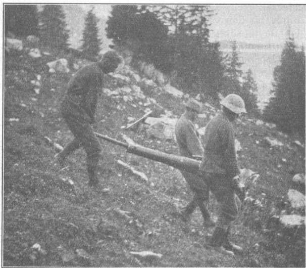
Kanoniere an der Arbeit. Canonniers au travail.

Den Manövern der 6. Division zollte der Wettergott alle Gnade, fürwahr, unsere ostschweizerischen Milizen dürfen mit diesem geradezu idealen Wetter zufrieden sein. Das zeigte sich zweifellos nicht nur an, sondern auch hinter der Front, Stimmung und Gesundheitszustand waren sehr gut und auch hinsichtlich des äusseren Eindruckes; kaum, dass man eine beschmutzte Uniform sah. Die überwiegende Zahl aller Soldaten standen auf dem Standpunkt, dass die allerdings sehr starke und drückende Hitze immer noch angenehmer sei, als nasses, regnerisches Wetter. Der trockene Boden ersparte den Truppen grosse Reinigungsarbeiten an Montur, Waffen und Geräten, Pferden und Fahrzeugen und erleichterte die Operationen aller Waffen in weitgehendem Masse. Die bereits erwähnte Hitze, dann auch die grosse Staubplage, verbunden mit ansehnlichen Marschleistungen, sorgten jedoch dafür, dass auch diese Manöver nicht ohne Strapazen verliefen.