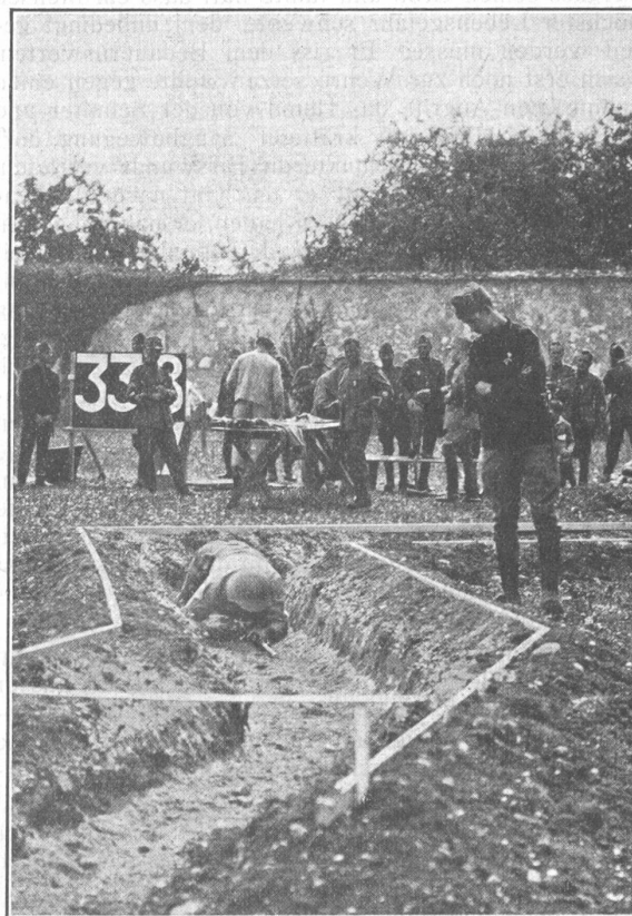
Hindernislauf in Solothurn