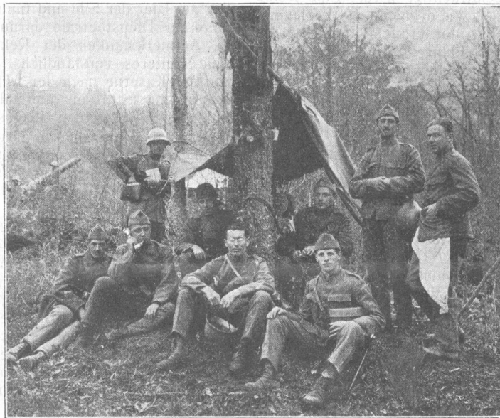
Station de téléphone