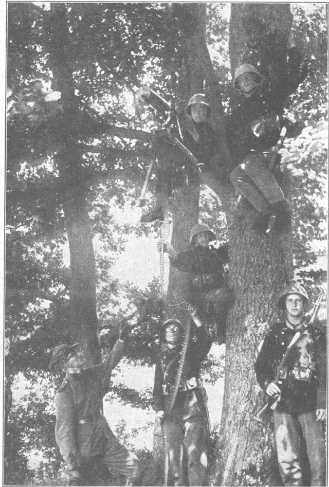
Maschinengewehr auf einem Baum Mitrailleuse en position sur un arbre.

die Abrüstung des bürgerlichen Staates zu propagieren), sie lehnen, und vor allem die religiös «Erleuchteten» unter ihnen, nicht etwa nur in einem ganz besonderen Falle eine Unterwerfung unter das Gesetz, das Recht ab, sondern sie erheben den grundsätzlichen Anspruch, jedesmal, wenn der Staat, die Gemeinschaft, eine Forderung an sie stellt, von sich aus zu entscheiden, ob sie den Vorschriften des konkreten Rechtes gehorchen wollen oder nicht. Ungehorsam, Feigheit und Verrat versteckt sich bei ihnen hinter das Gewissen! Welch' ungeheuerlicher Anspruch! Kann sich doch jeder andere Rechtsbrecher, mit dem gleichen Recht «auf sein inneres