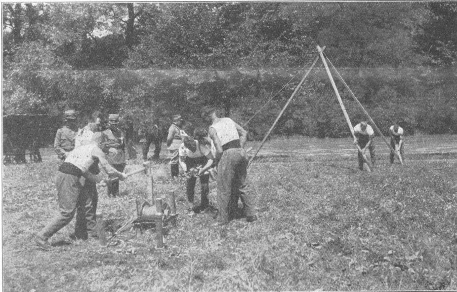
Eidgenössisches Pontonierwettfahren Aarau. Bootföhrenbau. Journées suisses de pontonniers à Aarau. Construction d'un bac.

Dann gibt der Himmel seinen Segen Dem Volke, treu auf sich gestellt, Und unter Blitzen, Sturm und Regen Gedeihet das bestellte Feld.