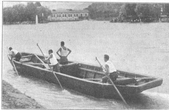
Eidgenössisches Pontonierwettfahren Aarau. Stachelfahren. Journées suisses de pontonniers à Aarau. La rame est remplacée par la pique.

Ihn besänftigen, ihn zur Ordnung weisen, oder ihn — was noch besser ist — bei Zeiten, d. h. wenn er noch keinen «sitzen» hat, ins Schlepptau nehmen . . . auch das sind kameradschaftliche Dienste! Kameradschaft schon am ersten Tag: c'est le ton, qui fait la musique! Capo.