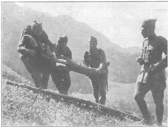
Die Truppensanität transportiert den Verletzten auf die bereitstehende Bahre.