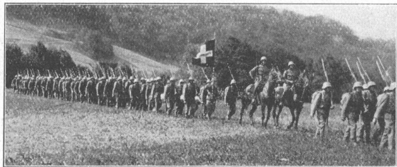
Wie unsere Soldaten defilieren.

In der Frage des Unteroffizierskaders soll ein weiterer praktischer Schritt unternommen werden. Zwischen