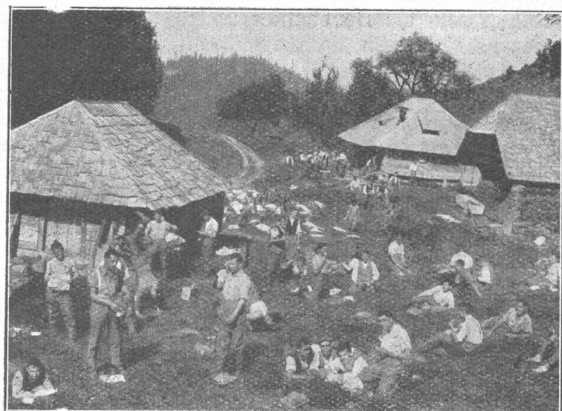
Nach der Verpflegung der Gebirgsinfanterie. La sieste après le repas chez nos «alpins».

ursachen können. Wir hatten doppelt recht, vorsichtig gewesen zu sein, denn auf einmal erschien in dem ungefähr zwei Meter tiefen Loch ein von Kälte und Atemnot blaueschwellenes Gesicht. Ein schrecklicher Anblick! Die Stange hatte den Mann mitten ins Gesicht getroffen. Ueber dem Kopfe war ein ziemlicher Hohlraum entstanden durch die dem Munde entströmende warme Luft. Obwohl der Verunglückte völlig ohnmächtig war, liess er ganz unmenschliche, knurrende Klagelaute hören. Doch er war gerettet, er lebte! Wir hatten dem Tode ein Opfer entrissen. Wir gruben ihn nun ganz heraus. Glied um Glied wurde sorgfältig vom Schnee befreit, wir wussten ja nicht, ob nicht etwas gebrochen war. Die Schneeschuhe und der Rucksack befanden sich ebenfalls in gutem Zustande auf dem Mann. Ein Arzt stellte fest, dass er kein Glied gebrochen hatte und auf einem Schlit-