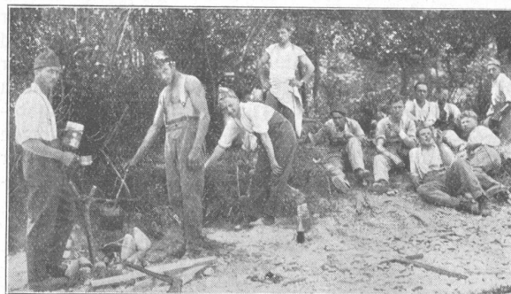
Die schöne Seite des Soldatenlebens: Das selbstbereitete Soldatenbankett.