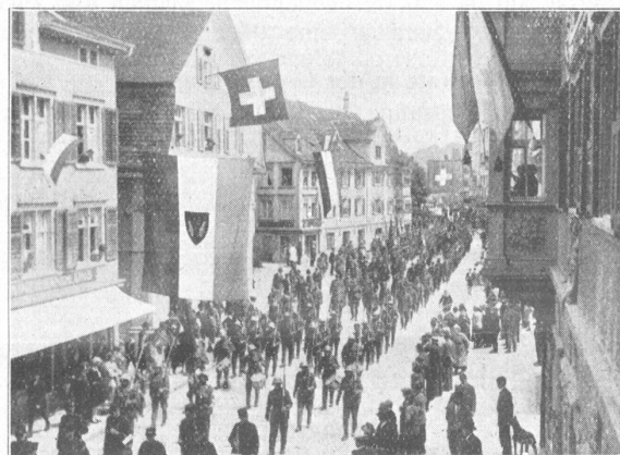
Delegiertenversammlung Rorschach. Einzug der Zentralfahne. Assemblée des délégués à Rorschach. Arrivée de la bannière fédérale.