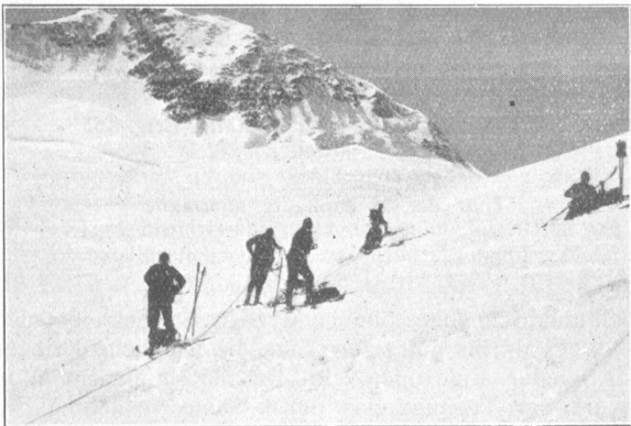
Hochgebirgs-Skitour der Geb.-Inf.-Brig. 10. Jungfraujoch-Grimsel, 25./27. IV. 30. Seilgruppen auf Oberaarjoch.

In der Tat weckte uns am Sonntag ein strahlender Morgen. Bei diesem grossartigen Wetter wollte gar mancher nicht auf die einzigartige Schönheit einer Gletscherfahrt mitten durch das Herz der Berneralpen verzichten. So wurden denn zwei Abteilungen gebildet. Die erste nahm ihren Heimweg wieder über das Jungfraujoch und wir, die übrigen 15, brachen um 6 Uhr nach der Grünhornlücke auf, wo schon die erste Abfahrt durch unvergleichlichen Pulverschnee unsere Mühen lohnte. Bald kamen wir bei der Finsteraarhornhütte vorbei zum Rotloch. Hier wurden unsere Skier wieder «befellt» und in gleichmässigem Tempo ging's dem Oberaarjoch (3233)