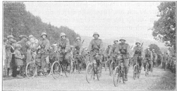
Wie unsere Soldaten defilieren.

Schon wird in England im Anschluss an diese Erfindung die Frage aufgeworfen, ob durch sie nicht die