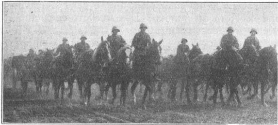
Wie unsere Soldaten defilieren. Die Artillerie. Comment nos soldats défilent: l'artillerie. (M. Kettel, Genf.)

Bei dieser Gelegenheit sei mir aber gestattet, darauf hinzuweisen, dass das Fortwerfen des gefassten Brotes durch die Truppen der 6. Division, während des Manöver-WK. im Jahre 1929, wie aus dem hr.-Artikel der Nummer 6 des «Schweizer Soldat» unwiderlegt hervorgeht, strafbar ist. Haben dies die Offiziere der betreffenden Einheiten nicht gesehen? Ich bin überzeugt, dass unsere Soldaten das leicht säuerliche Brot, trotzdem es