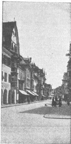
Bild links: Strassenbild mit Kirche im Hintergrund Bild rechts: Haus mit Erker

paru prévoit, entre autres heures de sérieux travail, quelques instants de plaisant réconfort, et l'horaire par temps radieux laisse entrevoir des choses insoupçonnées. C'est que l'on espère voir venir de nombreux visiteurs pour faire fête au soleil ces jours-là. Nous présentons aujourd'hui le séminaire des instituteurs de Mariaberg, dans la vieille et renommée salle de musique duquel se tiendra l'assemblée des délégués. Puis, nous illustrons une perspective de rue, un ancien balcon en saillie remarquable (proche l'Hôtel de Ville), ainsi que la fabrique d'aéronefs Dornier, d'Altenrhein, désormais mondialement connue, et, dans laquelle les puissants Do X pouvant transporter 100 personnes, reçoivent le jour. — Toutes choses doublement belles lorsqu'elles sont vues dans la nature ensoleillée et parmi les fleurs printanières.