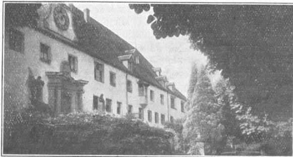
Lehrerseminar Mariaberg — Séminaire de „Mariaberg“