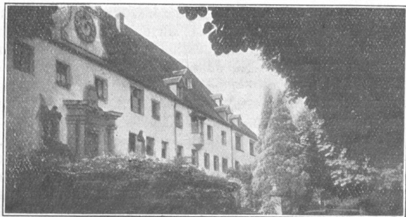
Lehrerseminar Mariaberg — Séminaire de „Mariaberg“