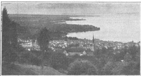
La colline du »Rorschacherberg« et les trois baies. Rorschacherberg mit 3 Seebuchten.

Nous nous efforcerons, dans de prochains communiqués, de mettre en relation plus intime les délégués avec les autorités de l'endroit; en attendant, le bureau de renseignements de Rorschach se tient à entière disposition pour répondre à toutes les demandes de renseignements qui pourraient lui être adressées.