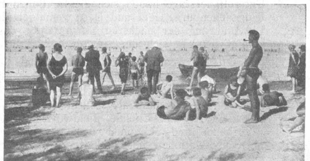
Strandbad. — La plage.