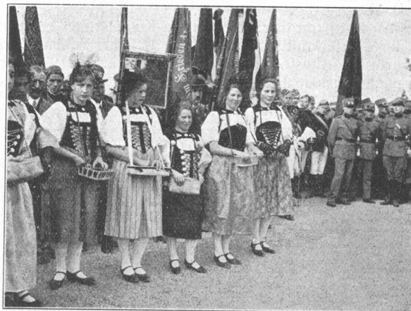
Gedächtnis- und Einweihungsfeier auf dem neuen Platz des Grauholz-Denkmal bei Bern. — Ehrenfräulein im Bernertracht.

Fête commémorative et d'inauguration sur la nouvelle place du monument du Grauholz près de Berne, le 30 mars 1930.