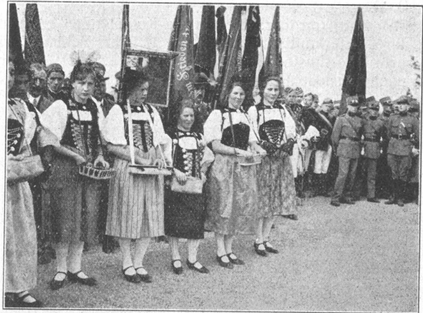
Gedächtnis- und Einweihungsfeier auf dem neuen Platz des Grauholz-Denkmal bei Bern. — Ehrenfräulein im Bernertracht. Fête commémorative et d'inauguration sur la nouvelle place du monument du Grauholz près de Berne, le 30 mars 1930. Demoiselles d'honneur en costume bernois.