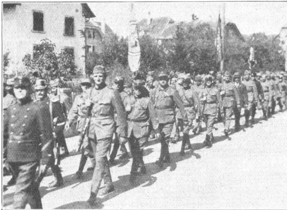
Teilansicht aus dem Umzug.

matt , sowie von verschiedenen höheren Offizieren verfolgt. Sorgfältige und zielbewusste Organisation, sowie die erfreuliche Mitarbeit der Herren Offiziere und die sympathische Anteilnahme der Behörden und Bevölkerung und nicht zuletzt die flotte Disziplin stempelten diesen festlichen Arbeitstag zu einer eindrucksvollen Kundgebung für die ausserdienstliche Tätigkeit der Unteroffiziere. Die unter der Leitung von Hrn. Hptm. Lysser stehenden Vorunterrichtsschüler des Kreises Seeland stunden den Veranstaltern als Warner etc. zur Verfügung und marschierten auch vollzählig in flotter Haltung in dem nach Beendigung der Arbeit organisierten Umzug mit. Um 4 Uhr besammelten sich die Teilnehmer im grossen Saal des Hotels Kreuz zum Schlussakt. Nach Vorführung eines eindrucksvollen Bühnenbildes beglückte Herr Oberst Hochuli , Ehrenpräsident der Veranstaltung die Ehrengäste und Teilnehmer, lobte die Bestrebungen der Unteroffiziersverbände und belegte ihre Notwendigkeit. Auf die erzieherischen Werte der militärischen Ausbildung eingehend, kam er auch auf die notwendige ausserdienstliche Weiterbildung zu sprechen und wünschte den auf dieses Ziel hin arbeitenden kantonalen und schweizerischen Verbänden ein weiteres Gedeihen. Als Vertreter der kantonalen Militärdirektion — Herr Militärdirektor Joss war inzwischen zu den Schwingern nach Langenthal gefahren — überbrachte Herr Major Roth die Grüsse der Berner Regierung. Für