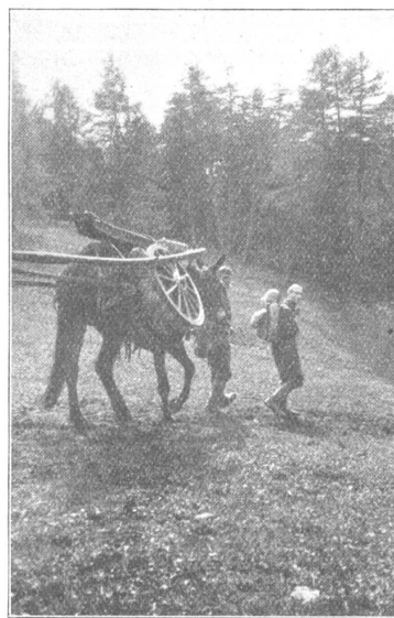
Prêt à partir

La batterie 2 quitte le Châble lundi à 15 heures et redescend à Sembrancher pour gagner Orsières où elle passera la nuit. Cette batterie est attachée au parti rouge, c'est à dire au R. I. 5 moins le bat. car. 1. La