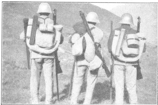
Gebirgspackung der L.-M.-G.-Gruppe Équipement de montagne de la groupe F.-M.-L.

Mercredi, le mauvais temps bien établi continue et ce n'est que dans l'après-midi que les brouillards se déchirent et permettent de voir le terrain. Ce mercredi, je me trouvais le soir au Col des Oujets de Mille, du côté de Bagnes, la première descente est raide et s'arrête brusquement sur un grand plateau vert qui contraste avec la terre grise et les rochers du col. Le soir descendait lentement et les derniers rayons éclairaient