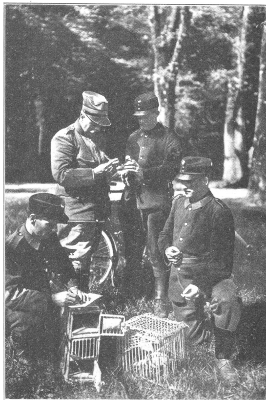
Brieftaubendienst. — Ankunft einer Meldung.

Hurra! Gerne wird auf die übliche Mittagspause verzichtet und 3.15 Uhr steht die Gefechtsbatterie wieder marschbereit im Park, und allsobald befanden wir uns auf dem Anmarsche auf gleicher Strasse, die wir am Mittag von Ponte-Bevera her befahren hatten. Ein empfindlicher Nordostwind blies uns um die Ohren, als wir nach scharfem Trabe zur befohlenen Zeit vor Madulein mit «rechts anhalten!» Halt machten. Da vorerst die Batteriestellung rekognosziert werden musste, gab es einen langen Halt, bei welchem wir fast die Knochen abfroren. Endlich, es mochte ca. ½6 Uhr abends geworden sein, kam Leben in die Bude, resp. diesmal in die