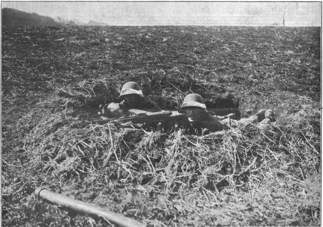
LMG-Nest. — Un nid de mitrailleuse (F.M.L.)