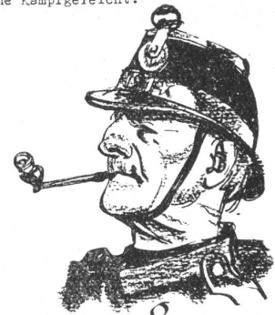
Der Veteran. Wer anno Siebezgi schon mitgemischt, Der weiss bimeid, wie s'Pulver chracht!