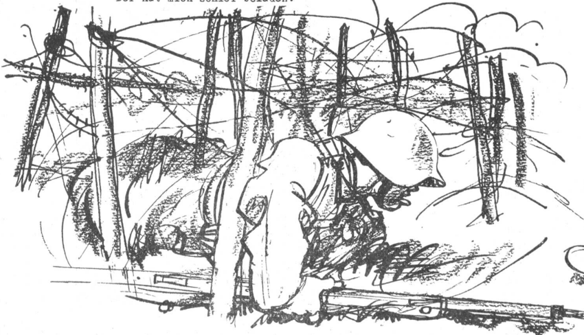
Hindernislauf. Wo Dornen über den Weg gewachsen, Wirst fluchen du, nicht etwa grochsen!