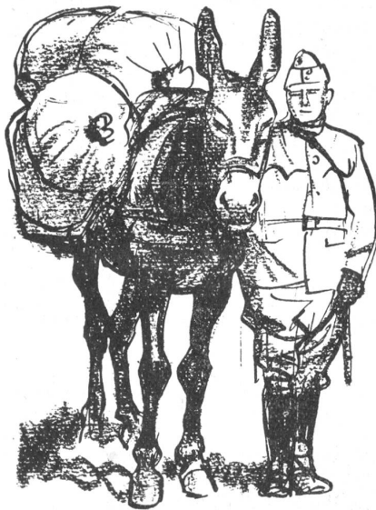
Kameraden. Ich hatt' einen Kameraden ... Der hat mich schief beladen.