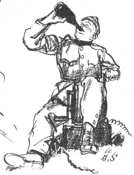
Der Funker. Ohne Kraft und Stoff bleibt stoh, Selbst der beste Dynamo!

Texte und Zeichnungen von Hans Schaad, Spezialzeichner der Schweizer Illustrierten Zeitung