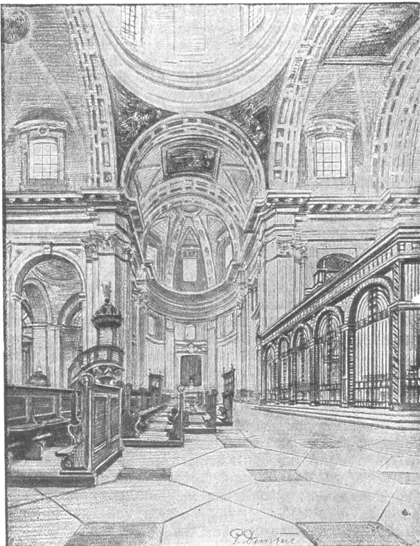
St. Ursenkirche — Inneres