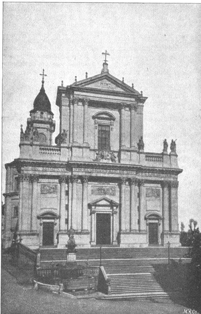
St. Ursenkirche — Fassade — Eglise St. Urs

dich leisten wir unsern Militärdienst, Gott schulden wir ein unbeflecktes Leben.» So hatten die Thebäer bei Augannum droben gesprochen, als der Kaiser sie mit Folter und Tod bedrohte, und willig hatten sie ihren Nacken dem Schwerte gebeugt und sich geweigert, trotzdem sie in grosser Zahl gewesen, mit der Waffe in der Hand gegen den Kaiser sich zu wehren. Vom gleichen Geiste beseelt, waren Ursus und Viktor und ihre 60 Gefährten, die, im Castrum Salodorense ergriffen, lieber den Tod leiden, als ihrer Pflicht untreu werden wollten. Sie wurden darum auf der Brücke, die damals