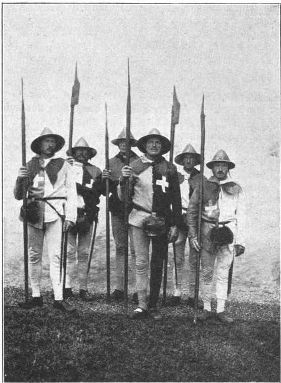
Sempacher Schlachtfeier. — Kostümierte Gruppe. Fête de la bataille de Sempach. — Groupe costumé.