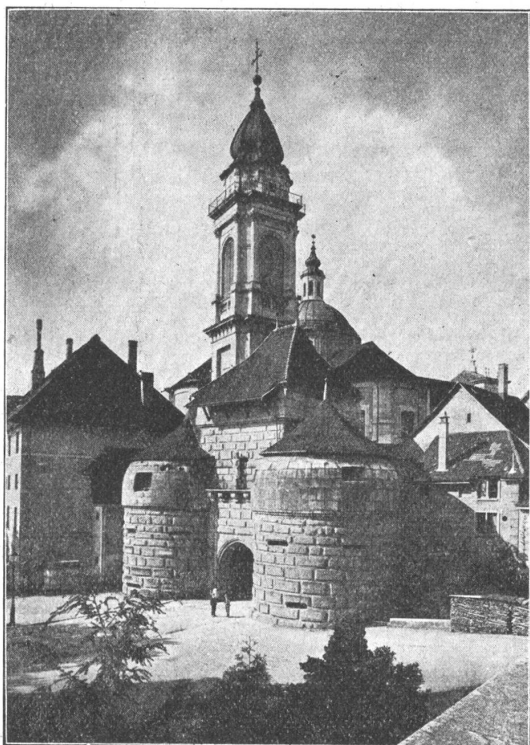
Solothurn - Soleure