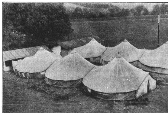
Sanitätszelte (Ambulanz). — Tentes sanitaires (Ambulances).